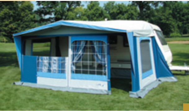
Variante con balconcino