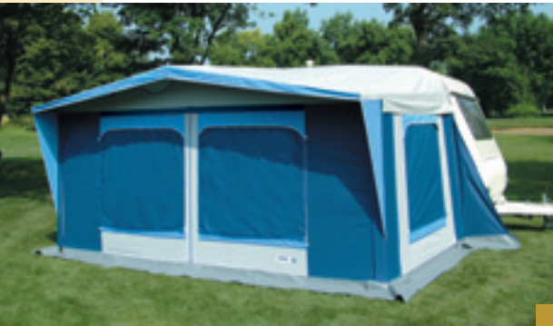
Variante con oscuranti abbassati