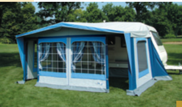
Variante con porte aperte