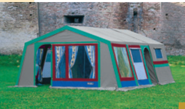
Variante "full space"