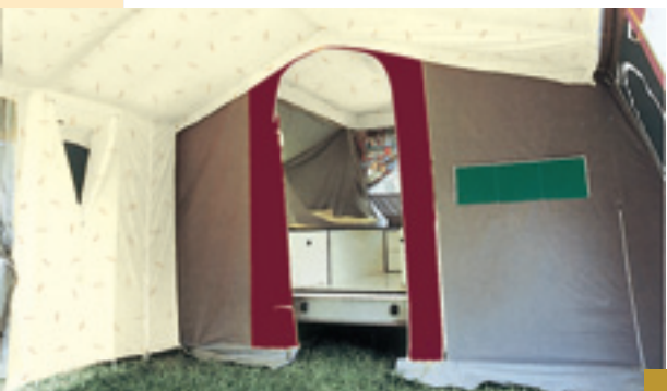
Particolare interno (veranda)

“PEGASO” è un carrello tenda a 6 posti con comodo montaggio semiautomatico. I materiali utilizzati garantiscono la massima impermeabilità e un'efficace traspirazione rendendo la zona abitabile fresca e confortevole. La parte anteriore può essere asportata fino all'estremità della veranda aumentando le dimensioni del soggiorno. La zona notte è composta da reti a doghe in legno e materassi 80 mm in gommapiuma ad alta densità ricoperti in tessuto di cotone 100% completamente sfoderabili.