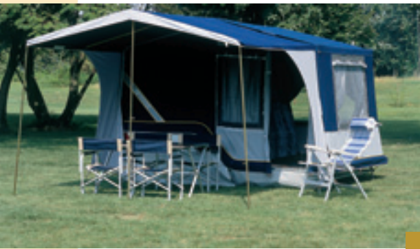
Variante solo carrello