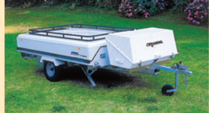
Carrello chiuso con gavone